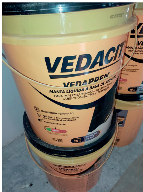
Foto: Aquisição das mantas líquidas.