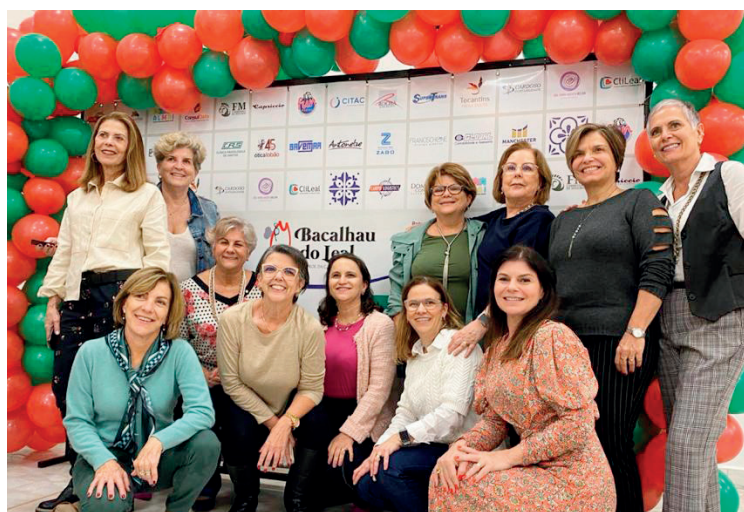
Foto: Companheiras do Rotary Club de Santos-Boqueirão.