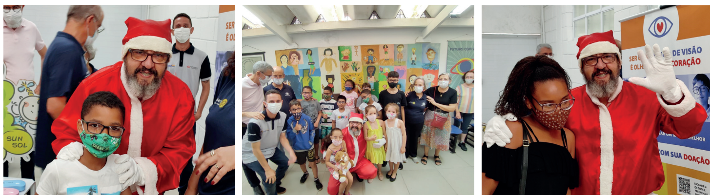
Foto: Registros da entrega especial de Natal na sede da Casa da Visão com a participação dos companheiros do RCSO.