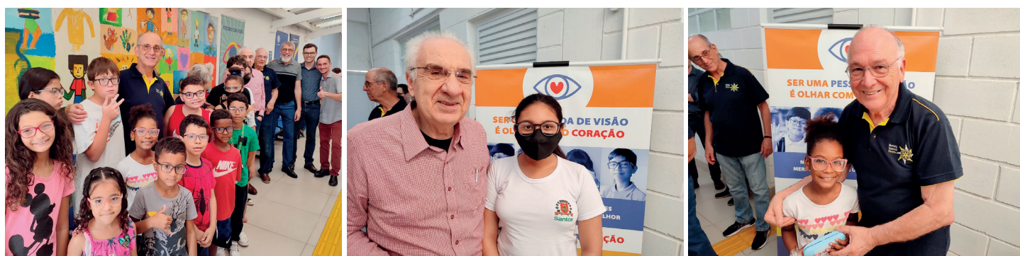
Foto: Tarde especial do dia 13 de outubro, na entrega dos óculos pelo Futuro com Visão, com a presença de rotarianos e médicos da Casa da Visão, em comemoração do Dia das Crianças (12) e o Dia Mundial da Visão (13).