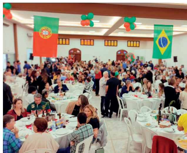
Foto: Imagem do salão de eventos do Centro Cultural Português lotado na 3ª edição do Bacalhau do Leal.