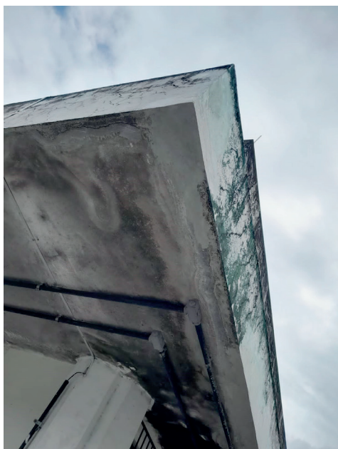
Foto: Infiltração na parte inferior da marquise.

da uma vedação com manta líquida à base de asfalto que impermeabilizará as áreas comprometidas. Após finalizarmos esse processo, a próxima etapa será refazer toda a pintura das marquises.