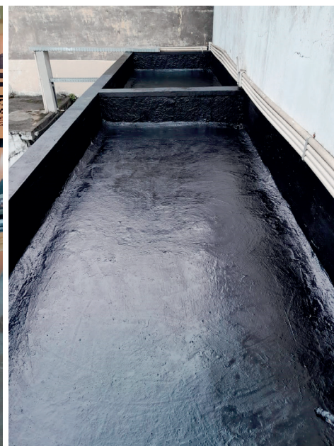
Foto: Parte superior da marquise após a aplicação da mantas líquida.